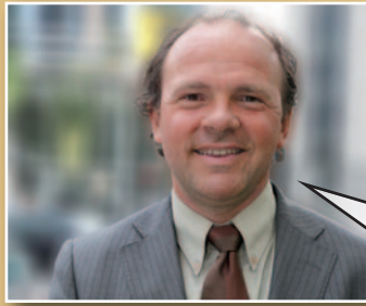
Philippe Muylers Vlaams minister van Financiën en Begroting

“Het Dexia-dossier hangt dit land als een molensteen om de hals. Als het verder fout gaat, stijgt de Belgische staatsschuld gigantisch. Ik vind dit gewoon hallucinant. De onbeantwoorde vragen stapelen zich ondertussen op. Maar Di Rupo zag geen beletsel om de Dexia-bestuurders kwijting te verlenen. Enkel het duidelijke ‘neen’ van de Vlaamse Regering deed de Belgische stem nog naar een ‘onthouding’ schuiven. Niet te begrijpen.”