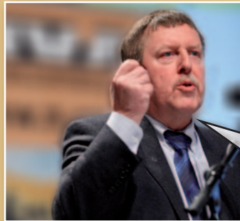
Siegfried Bracke N-VA-Kamerlid

“Ik stel keer op keer vast dat het onderscheid tussen CD&V, Open Vld en sp.a gewoon verdwijnt. Het zijn drie partijen die samen - en warmpjes - in het apparaat zitten. Kijk naar het debat over de gas- en elektriciteitsprijzen. Plots roept men energienetbeheerder Eandis uit tot vijand nummer 1. Laat me niet lachen. Wie bestuurt Eandis? Dat zijn 8 CD&V'ers, 4 sp.a'ers en 4 Open Vld'ers. Ook in die zin is de N-VA vandaag dé uitdager van het systeem.”